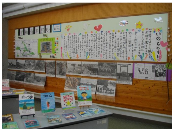
事前学習での資料展示の様子