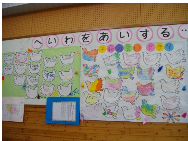
子ども達による平和のメッセージ